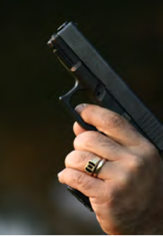
تۆمەتباران رايپچى دادگا ناكرىن