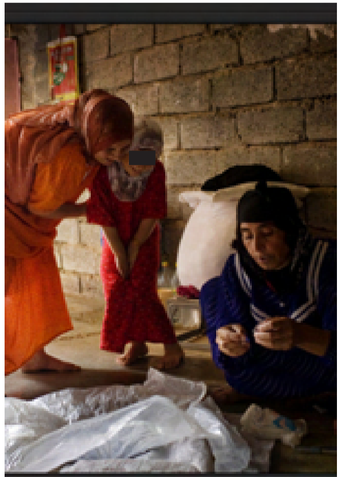
خەتەنەكردن ھەدەغە ناكرىت