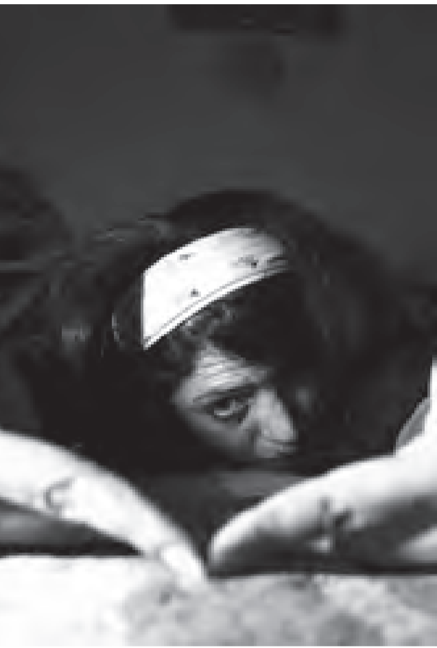
ئازارەكان كۆتايى ناپەت

خەسرەو ساپە پىي واپو كە ئەيىت دەلەتلىك بىنن و دەستورلىكى بىنن، كە فشارى خەلك و فشارى تاكى كۆمەلگاي رىكخراۋەكان بىتوانرت كارنەوئەى لەسەرى ھەيىت. سەبارەت بەرولى دەسەلات لە زىادبوونى توندوتىۋى دژ بە ئۇنان خەسرەو ساپە وتى "ئەوان ھەر خۇيان ئەو ياساپانە دەخەنە ژيىر پىئو كە دايا نەو، بۆئە ئەيىت بزوتنەوئەى ئۇنان بە بزوتنەوئەى سىياسى بىنن دەرەو لەبال ئەخراپى سىياسىدا بۆ گۆرىنى كۆمەلگاي بۆ قودرەتگرتنى خۇى، ئۇنانىش ئەيىت بەشىك بن لە بزوتنەوئەى سەلبى مەشرەپەت و دەسەلاتى مەوجود ئىنجا دەتوانن خواستەكانى خۇيان جىبەج بگەن، بزوتنەوئەى سىياسى بەرامبەر بەم دەسەلاتە دەيىت بىتوانرت چاكسازى بكات ئەگىنا ھىچ چاۋەروائىك بەرامبەر بەم دەسەلاتە نىيە".