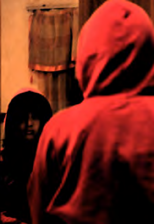
خەمۆكى بەرئەنجامى توندوتىۋى